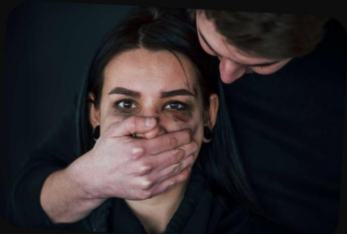
Example of a re-sacrificing photo.

Re-victimization can involve victim blaming, doubting the victim's story, or minimizing the seriousness of the crime. It can leave a deep psychological scar on the victim, reducing their mental capacity and trust in the justice system.